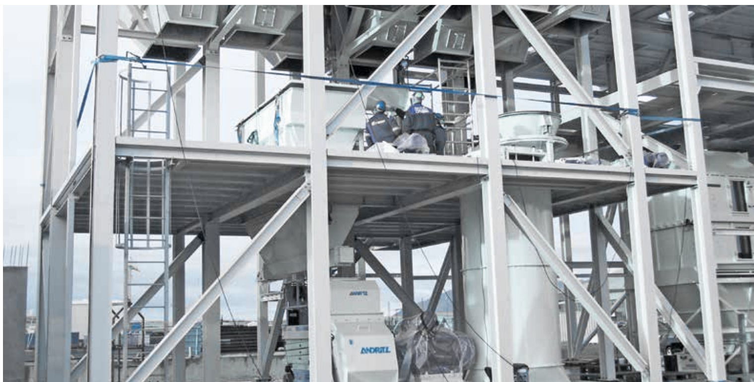
▲ The ANDRITZ concept