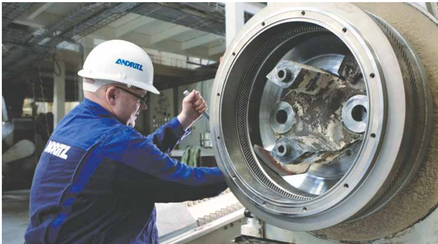
▲ Service and support