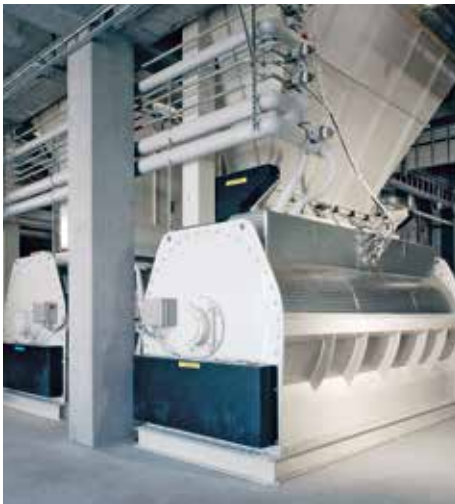
◀ CM series for pre-conditioning with addition of liquids and steam, providing optimum mixing and retention time.