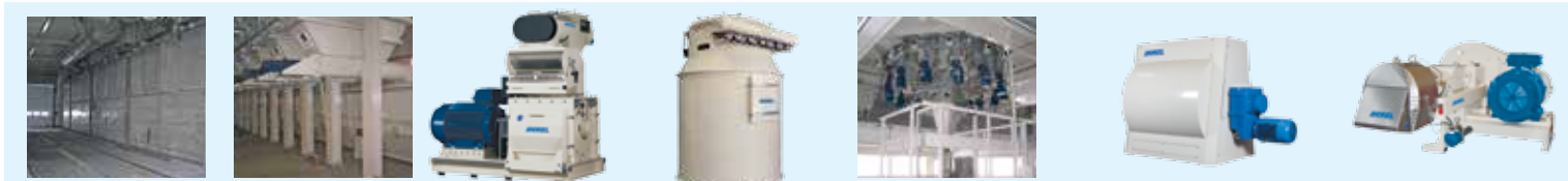
▲ Bulk intake system ▲ Ingredients silos ▲ Hammer mill ▲ Aspiration filters ▲ Weighing unit ▲ Optimix ▲ Feed expander

ویتامین ها، آروماتیک ها و پیگمنت های مایع برای استفاده مجزا و یا همراه با پوشش (وکیوم) روغن/چربی.