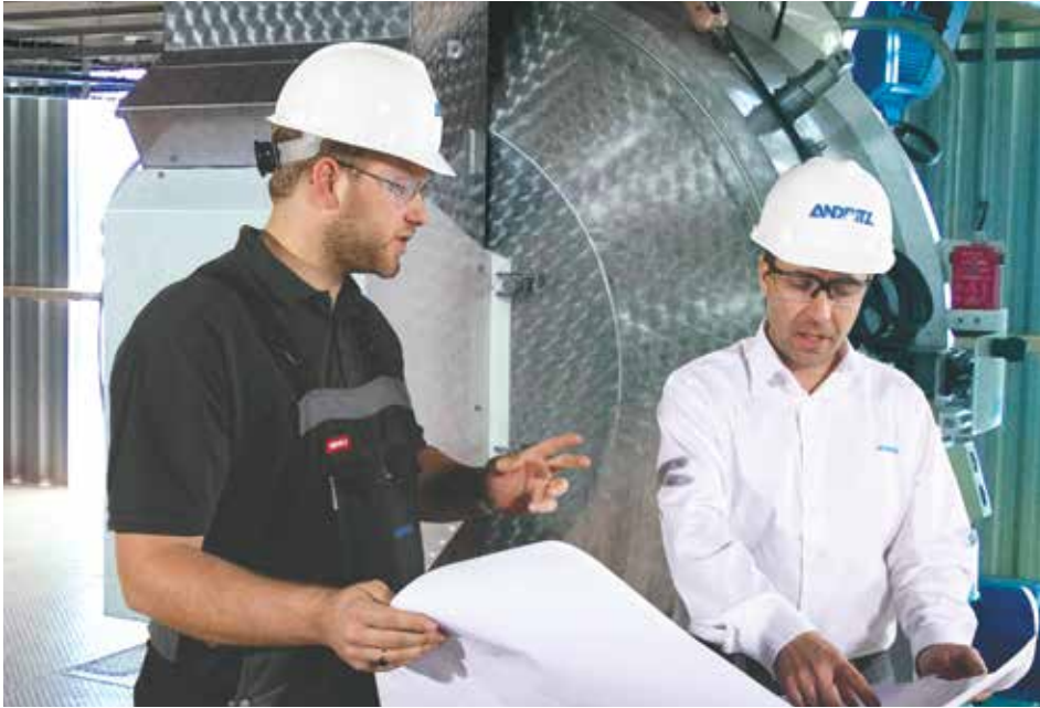
▲ Together, we make a difference

اندريتز يکي از پيشگامان تأمين تکنولوژی ها، سيستم ها و خدمات مربوط به تجهيزات پيشرفته صنعتی برای صنعت خوراک حيوانات است