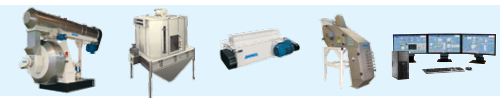
▲ Pellet mill ▲ Cooler ▲ Crumbler ▲ Micro-fluid addition ▲ Process automation

nd pelleting > Cooling > Sifting and coating > Finished feed silo/packing