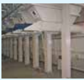
▲ Ingredients silos