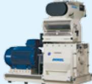
▲ Hammer mill