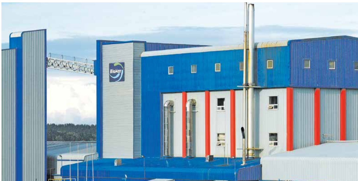
▲ Biomar Chile