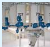
▲ Weighing unit