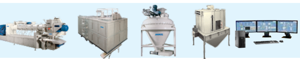
▲ Extruder ▲ Dryer ▲ Coater ▲ Cooler ▲ Process automation

Extrusion, and drying Coating and cooling Finished feed silo and packing