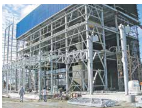
▲ The ANDRITZ concept

امروزه خواسته های الزامی برای مقرون به صرفه بودن، کیفیت و عملکرد بالای خوراک، این مسئله را آشکار می سازد که تولید خوراک با کیفیت، نیازمند سطح بالایی از تکنولوژی فرآوری تخصصی است