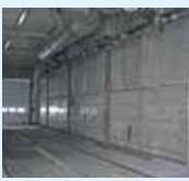
▲ Bulk intake system