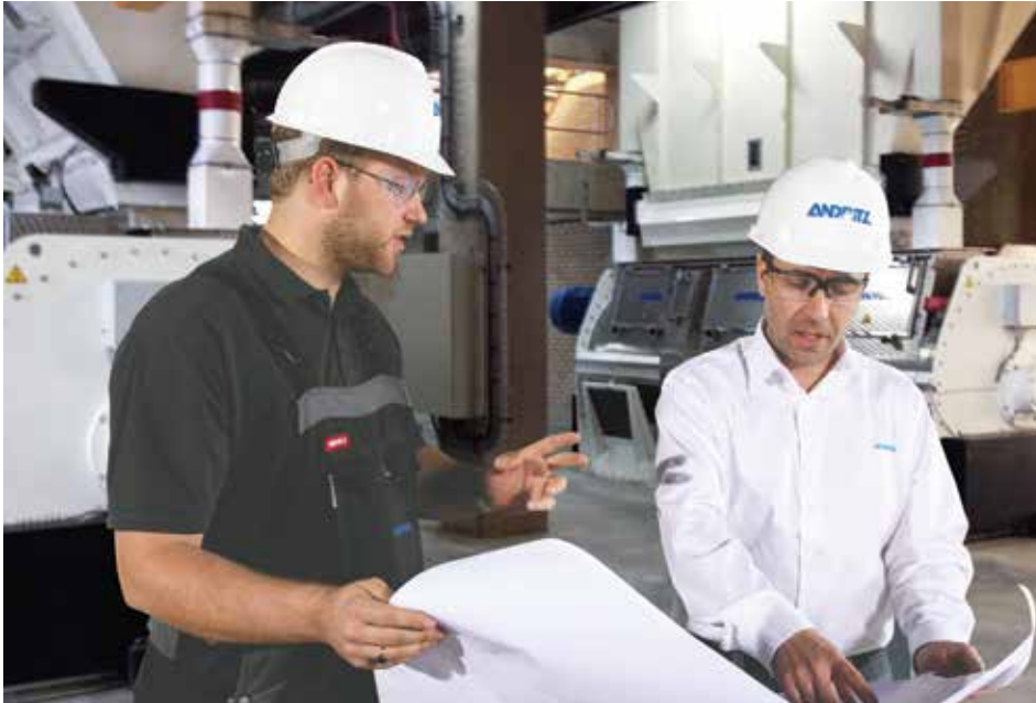
▲ Together, we make a difference

اندریتز یکی از پیشگامان تأمین تکنولوژیها، سیستم ها و خدمات مربوط به تجهیزات پیشرفته صنعتی برای صنعت خوراک حیوانات است