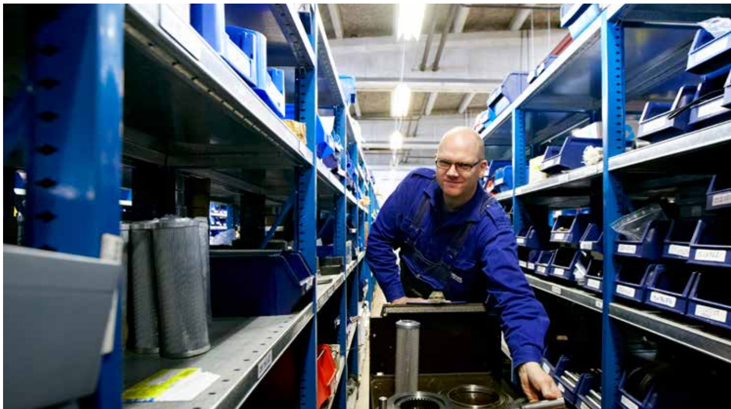
▲ Service and support